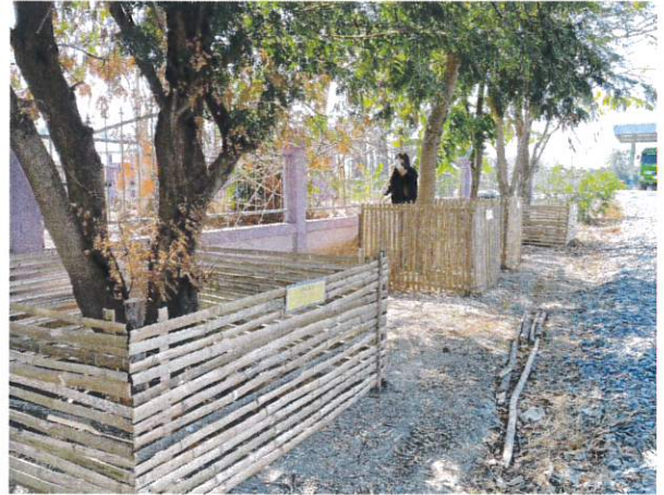
กิจกรรม Green Gain Day สร้างการเรียนรู้และสร้างแรงจูงใจไม่เผาแต่ได้รายได้