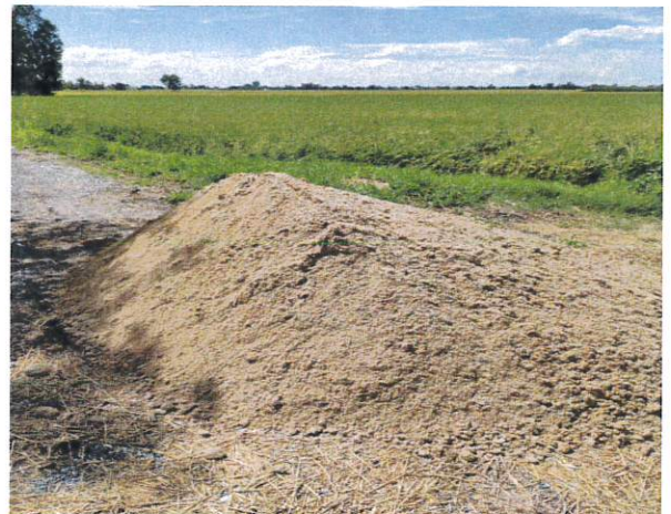
งบกลาง สำรองจ่าย จัดซื้อหินคลุก อบต.บ้านกุ่มและทางเข้า-ออก วัดรางบัวทอง งบประมาณ ๑๘๙,๖๐๐.๐๐ บาท