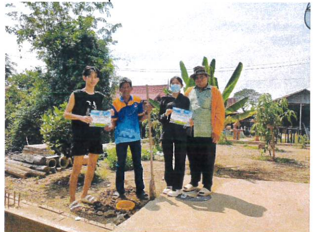
กิจกรรมดำเนินการซื้อ-ขายขยะรีไซเคิลธนาคารขยะ (Recyclable Waste Bank)